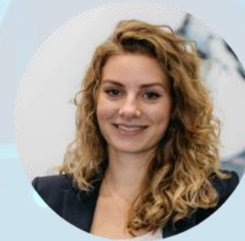
Nadja Dehne Kommunikation