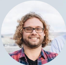
Alexander Bresk Organisation